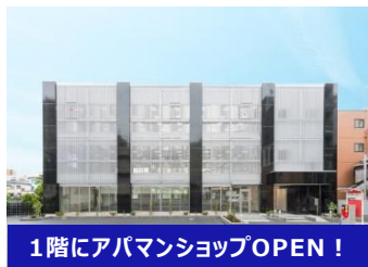
1階にアバマンショップOPEN!

ご参加の皆様・当日ご都合が合わない方も、個別にご相談をお受けいたします。ご相談は無料です。大切な資産を有意義に活用するためにお役立てください。